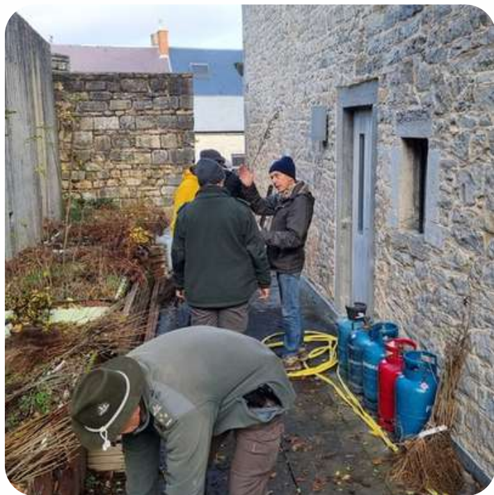
Distribution de plants pour la commune de Viroinval