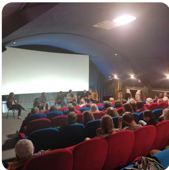
Une salle bien remplie lors du ciné-débat.