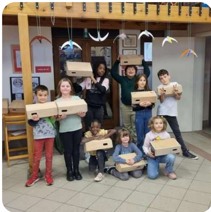
Des nichoirs à martinets construits par les enfants

Action de sensibilisation liée: Construction de certains éléments (nichoirs et planches à fientes) par les enfants des écoles de devoirs des deux communes. Les enfants ont bénéficié d'une animation sur le thème des oiseaux et des espèces ciblées puis ont été encadrés pour la fabrication des aménagements.