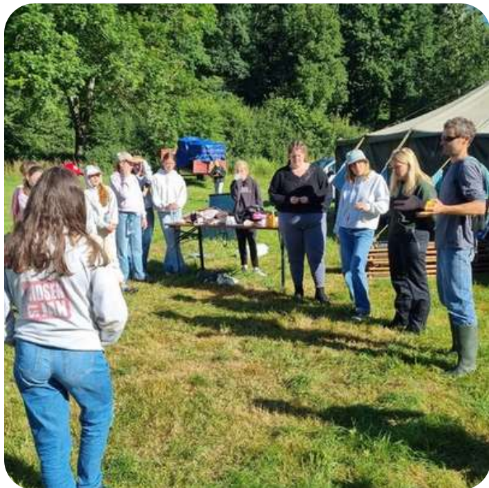
Pourquoi arracher la balsamine? Explications (en NI).

En outre, une de ces journées d'arrachage et de sensibilisation a été organisée avec des mouvements de jeunesse présents à Dourbes pour organiser l'arrachage à proximité de leur camp.