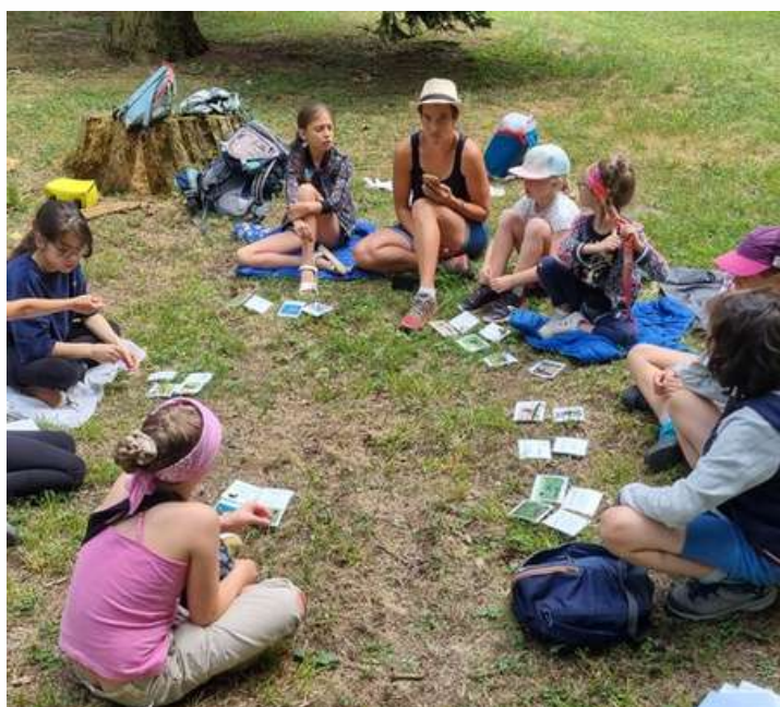
Des stages Nature dans la nature!