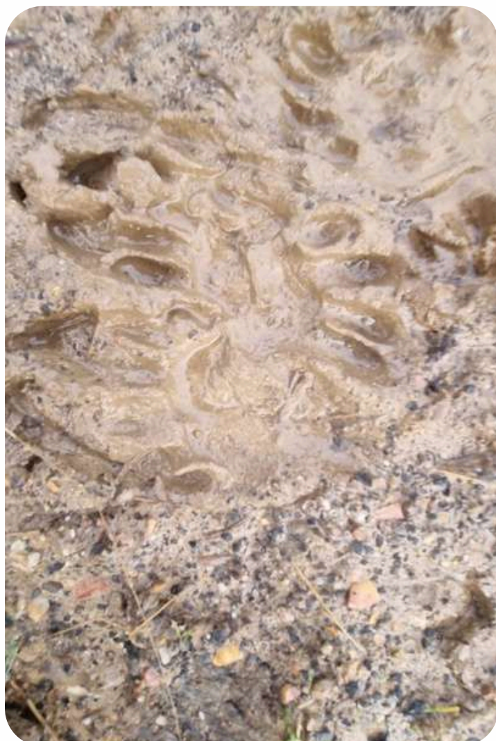
Traces de passage

Diverses améliorations seront proposées au DNF et à la commune de Couvin en 2023 (suppressions de seuil, végétalisation des entrées...) et des caméras à faune permettront un suivi avant-après travaux.