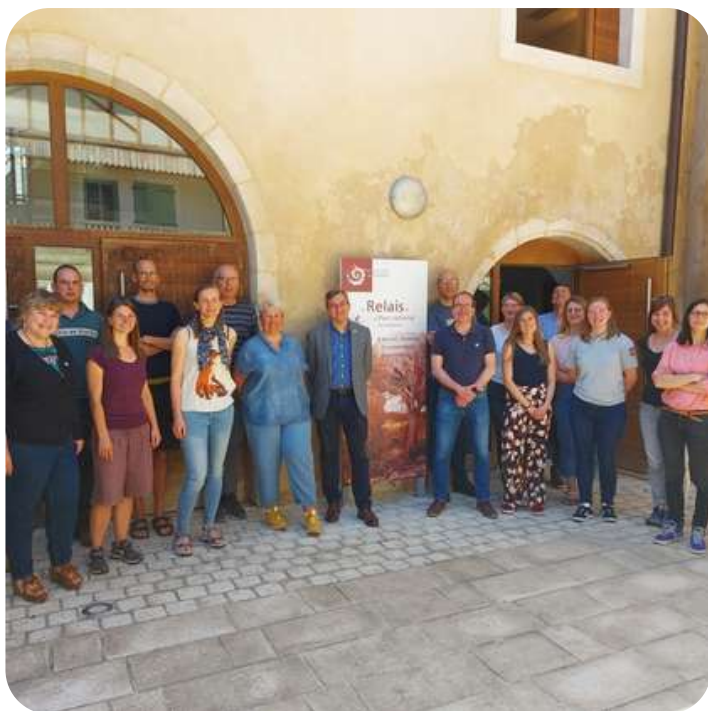
Journée d'étude dans le Parc national de Forêts