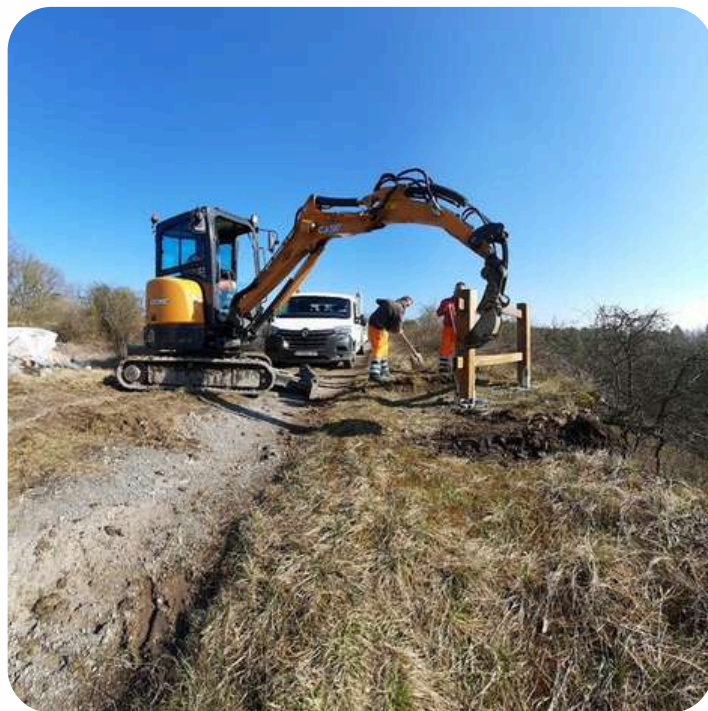
Pose de l'aire paysagère de Vaucelles.