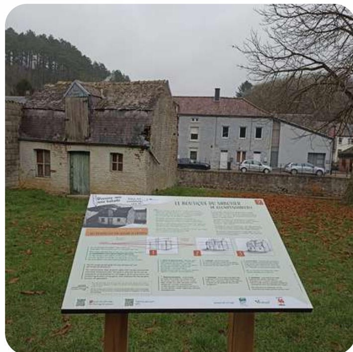
Ancien atelier de sabotier sur le circuit "Dessine-moi une balade"