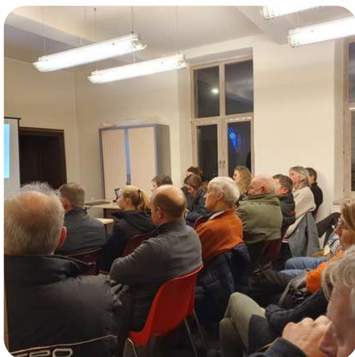
Un beau succès également pour la conférence.