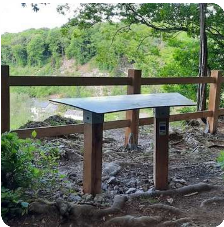
L'aire paysagère de Lompret est en place.

Ces aires paysagères sont constituées au minimum d'une table d'interprétation du paysage et peuvent être agrémentées de mobilier au choix des communes (table pique nique, barrière de sécurisation, panneaux d'informations,...).