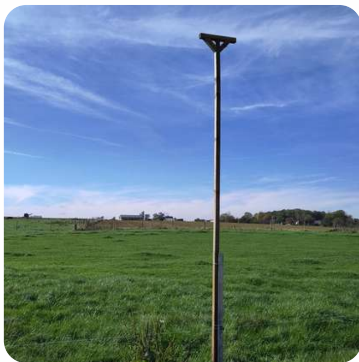
Placement de perchoirs à rapaces