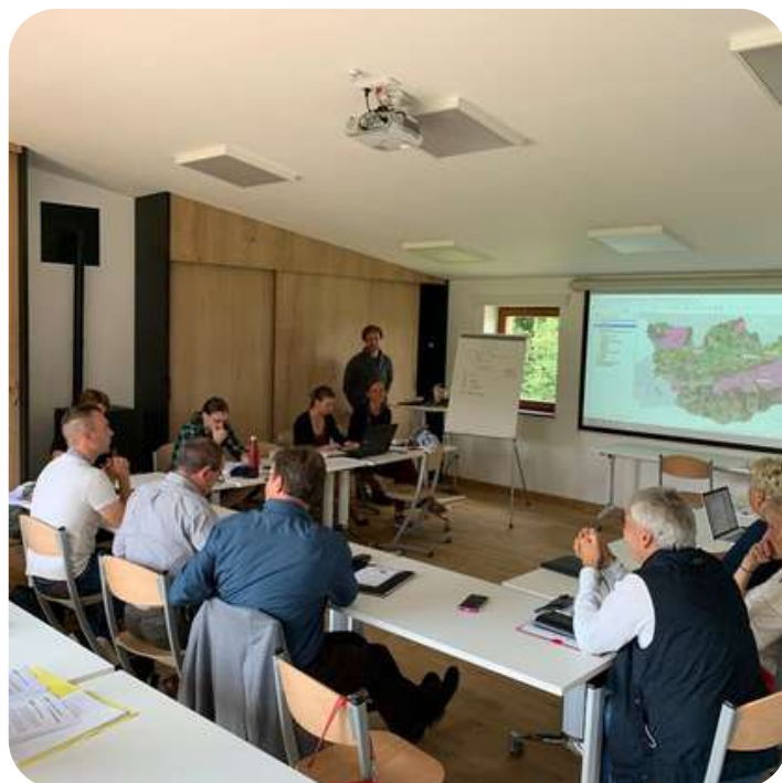
Réunion de la coalition territoriale