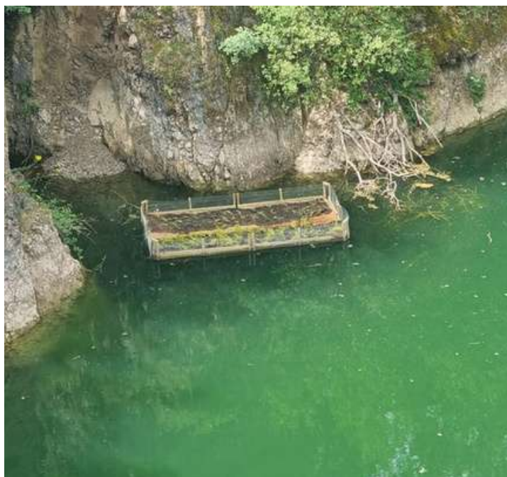
Renouées du Japon arrachées et radeau végétalisé en cours de placement