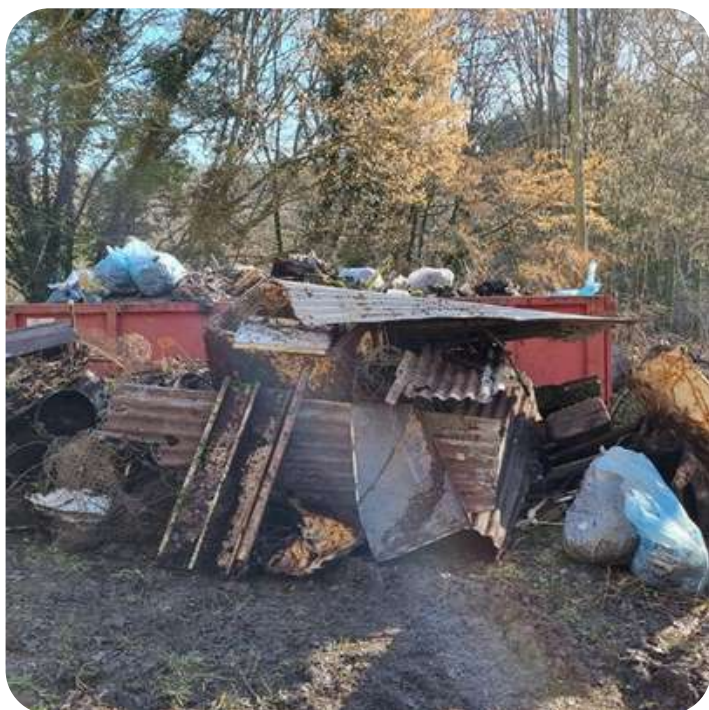
La quantité d'immondices évacués a été impressionnante à Le Mesnil.

Le Parc naturel a entrepris de participer progressivement à cette tâche importante en organisant chaque année au moins une opération de nettoyage d'un site naturel.