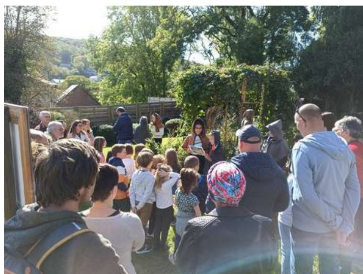
Inauguration du jardin médiéval