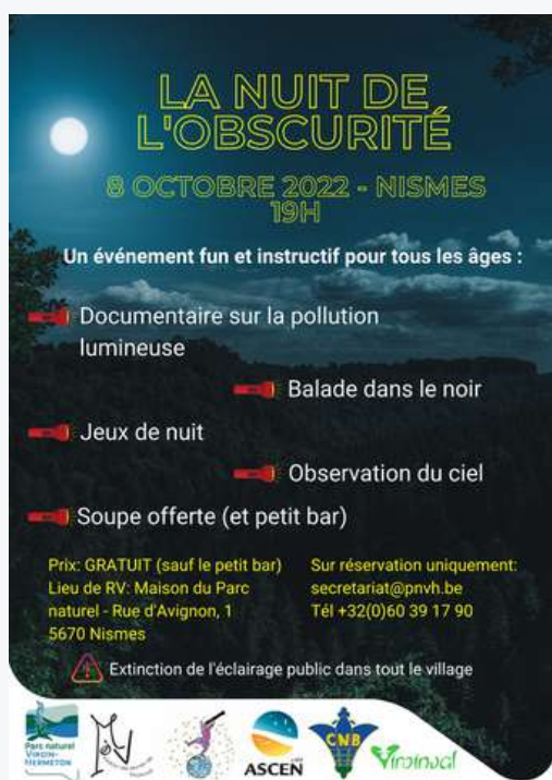
1 exemple de visuel créé