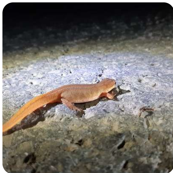
crapaud et triton en quête d'un lieu propice à leur reproduction