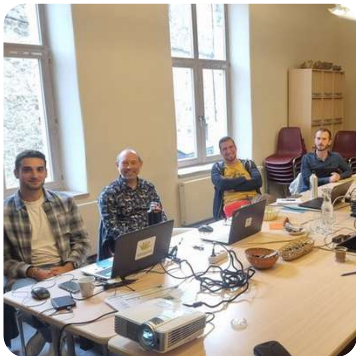
Des participants attentifs et souriants

ressources ainsi que l'information sur les procédures entreprises par les uns et les autres dans la rédaction de permis liés aux mares.