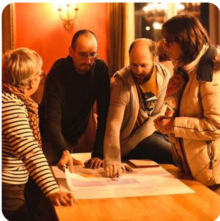
1ère réunion du PPP du GAL PNVH - atelier autour de la stratégie de développement local

Le processus de candidature GAL se poursuivra jusqu'au 21 avril 2023, date de dépôt de la candidature