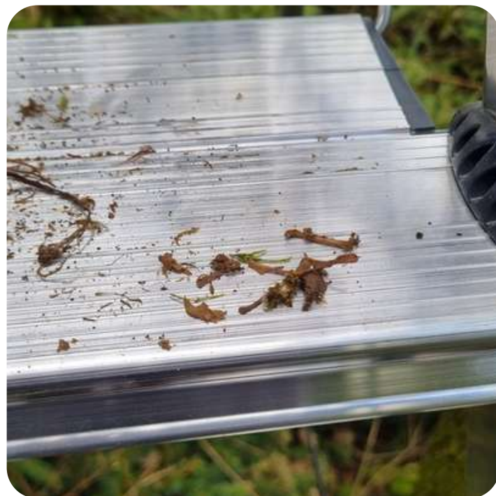
Ossements retrouvés dans un nichoir de chouette de Tengmalm