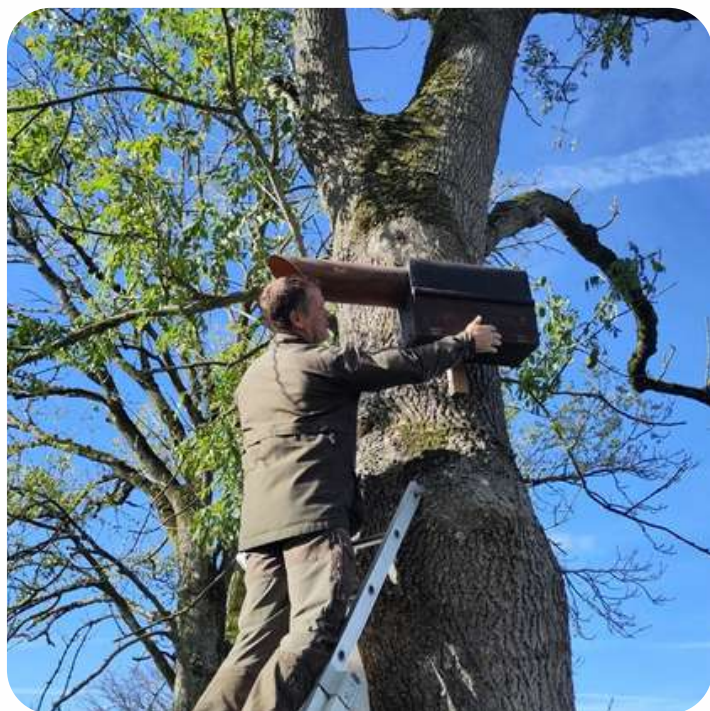
Placement d'un nichoir à chouette chevêche sur une exploitation agricole.