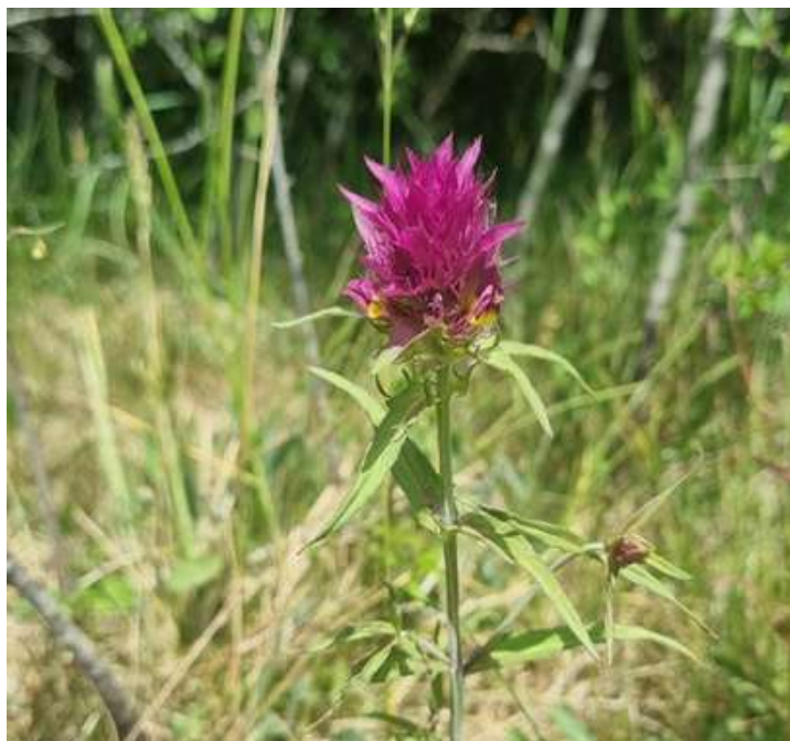
mélampyre des champs localisé lors des inventaires participatifs