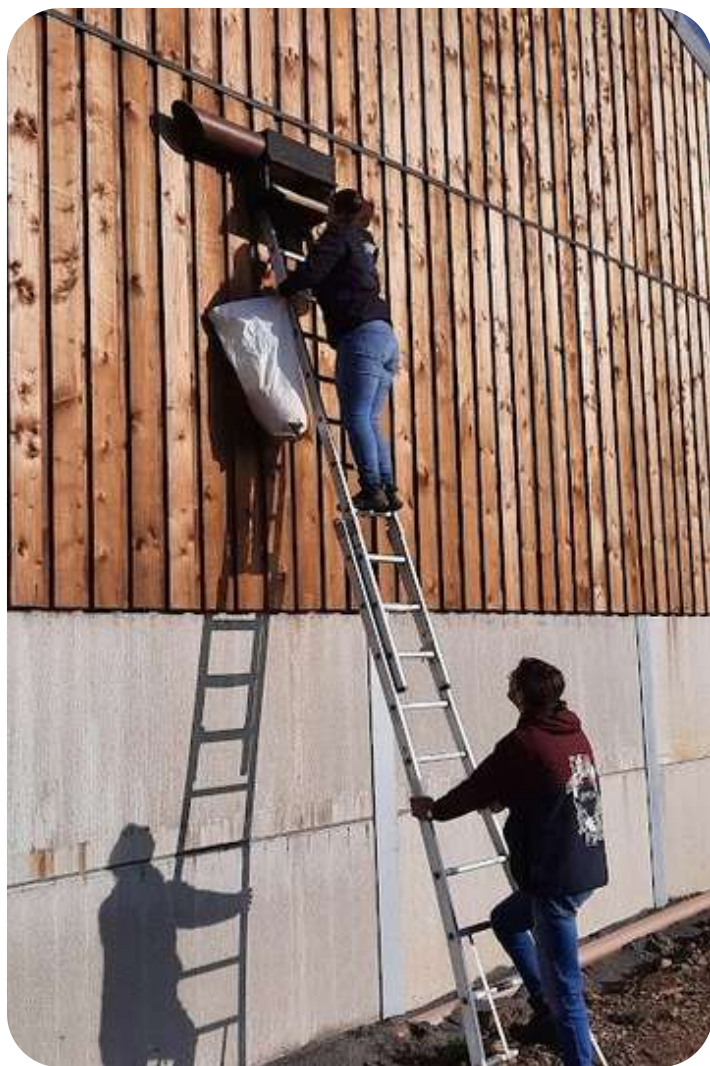
Pose d'un nichoir à chouette chevêche chez un agriculteur