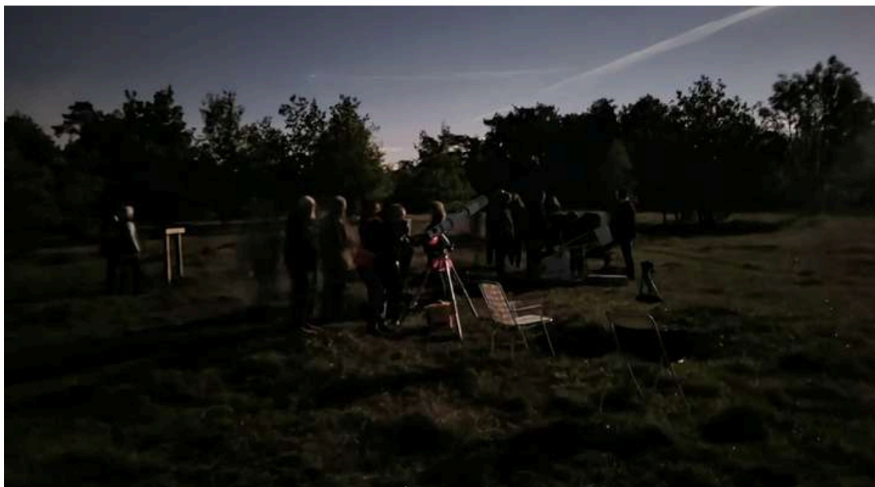
Une photo bien sombre qui illustre parfaitement la Nuit de l'Obscurité.