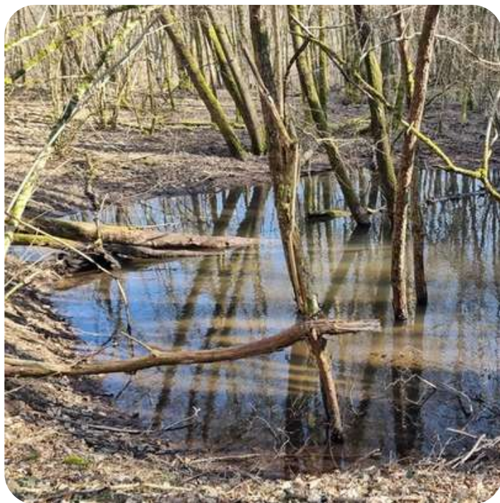
Mare à recreuser à la carrière de Grand-Mont