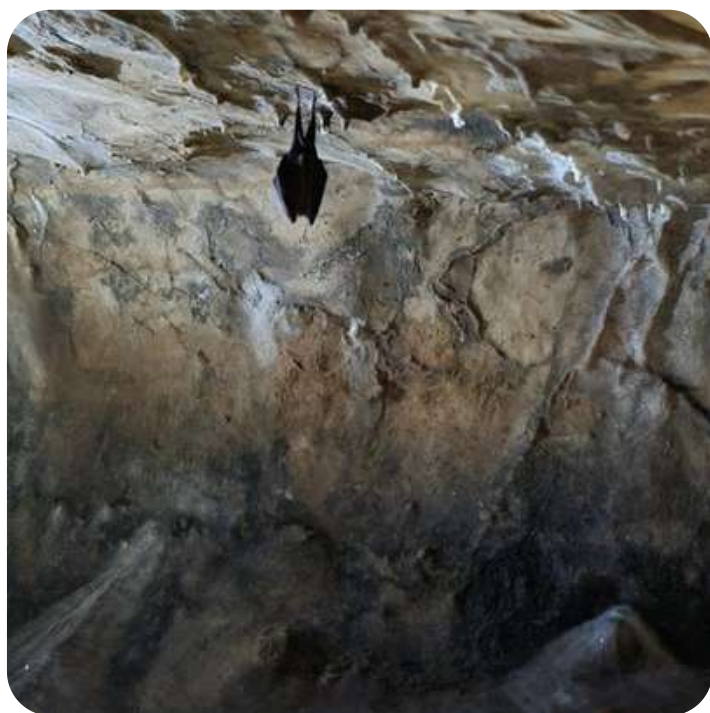
Grand Rhinolophe endormi dans la Roche Trouée

4 cavités ont été inventoriées (glacière St Roch, Roche Trouée, Grotte du Poilu et Fosse Alwaque) et encodées par Plecotus.