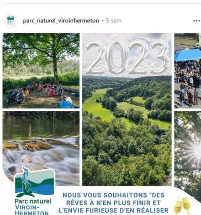
Le premier post sur le compte Instagram du PNVH

Un compte Instagram a par contre été créé en toute fin d'année. Il s'agira de le faire connaître en 2023.