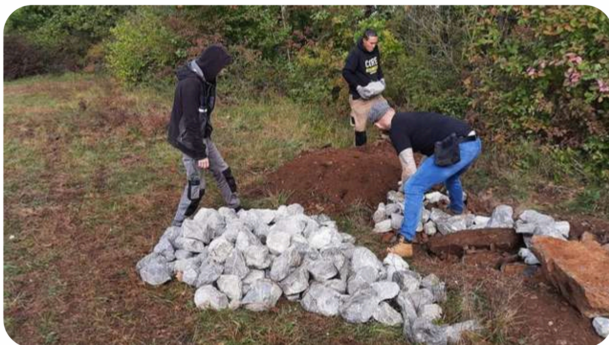
Construction d'un hibernacula lors de la Fête du Parc naturel