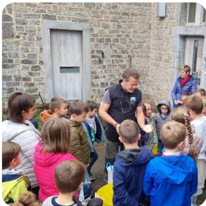
Animation sur la thématique des vergers et de la pomme