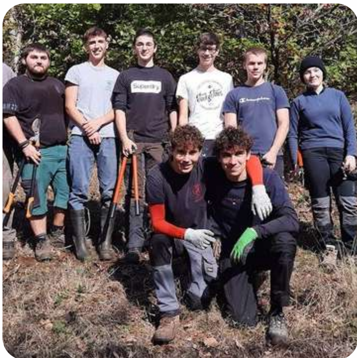
Des étudiants en horticulture motivés et efficaces