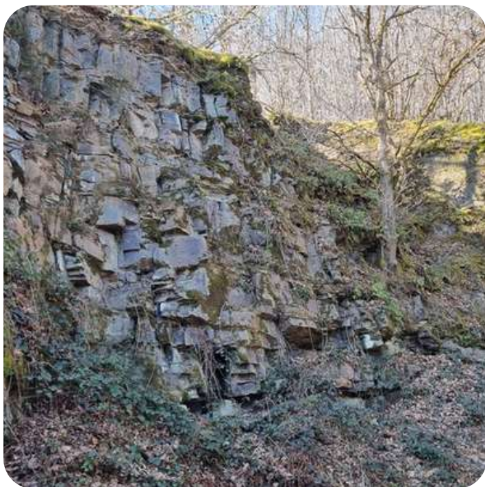
Ancienne carrière de Grand-Mont