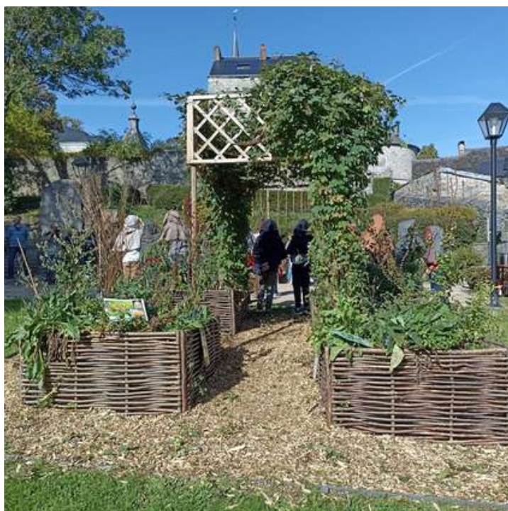
Inauguration du jardin médiéval