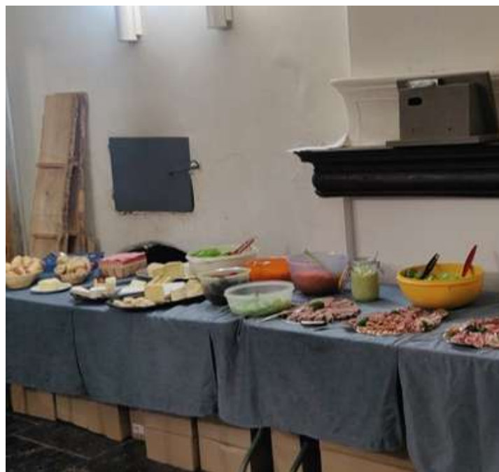
Une réunion de débriefing constructive et agréable