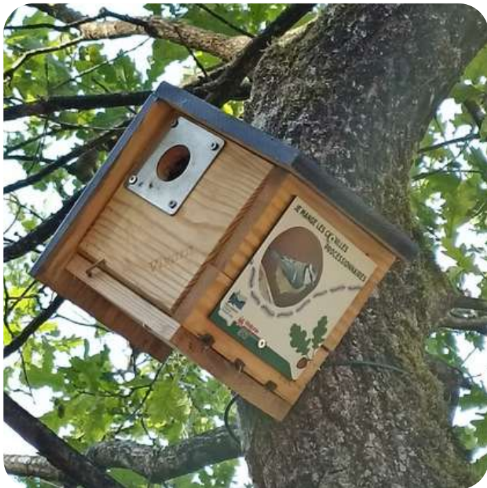
Nichoir à mésange installé comme moyen de lutte biologique

En collaboration avec le DNF local, le Parc naturel vient en appui de ses communes à l'encontre de la problématique en sensibilisant les citoyens, en mettant à disposition des outils cartographiques de localisation des nids et en testant des moyens de lutte biologique.