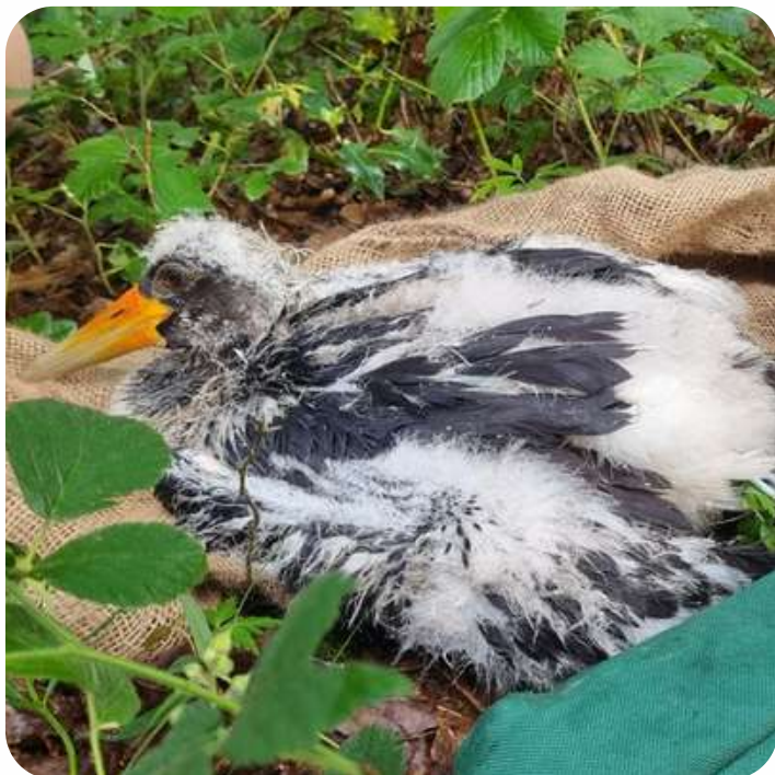
Bagage d'une jeune cigogne noire