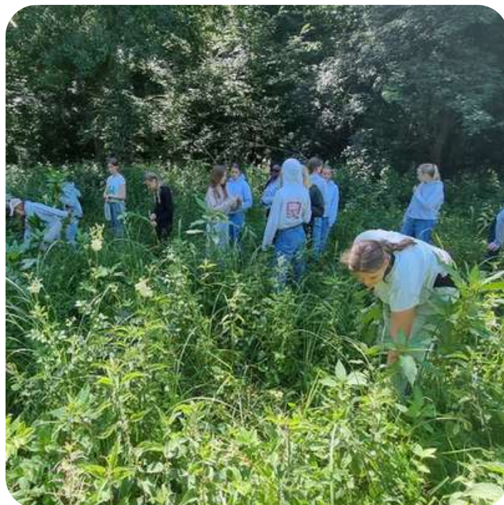
Arrachage de la balsamine avec les mouvements de jeunesse

La balsamine de l'Himalaya est une plante exotique envahissante ayant de nombreux impacts négatifs sur l'environnement. Afin de limiter son expansion et de l'éliminer, le Parc naturel, en collaboration étroite avec le Contrat de Rivière Haute-Meuse a participé à 7 journées d'arrachage de cette invasive sur les berges du Viroin et de l'Hermeton.