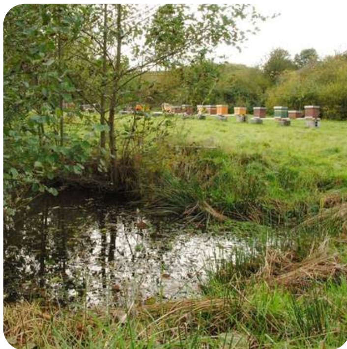
Le rucher école d'Olloy-sur-Viroin

donc programmées entre janvier et août 2023.