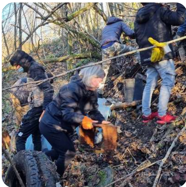
Des volontaires déterminés