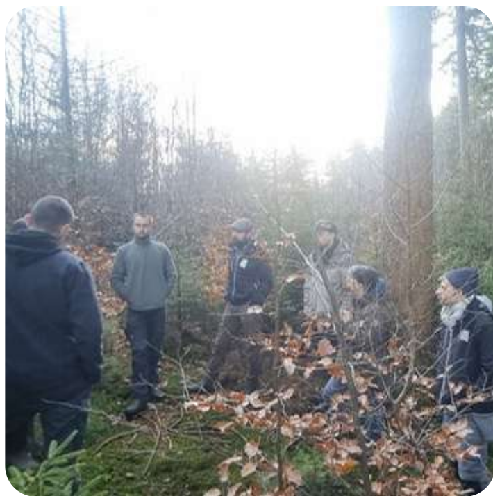
Projet Life Climat - Colorlife

En collaboration avec les cinq autres parcs naturels "forestiers", l'asbl "Forêt Nature" ainsi que la cellule d'appui à la petite forêt privée, un projet "Life Climat" - CoforLife a été déposé afin de pouvoir travailler sur la sensibilisation des propriétaires publics et privés à pratiquer une sylviculture plus résiliente aux changements climatiques futurs. Ce projet, déjà déposé en 2023, a été retravaillé et sera à nouveau déposé en 2025. S'il est sélectionné, il permettra de développer des outils de démonstration de l'intérêt écologique et économique d'une sylviculture mixte à couvert continu ainsi que de sensibiliser le grand public, les écoles et les propriétaires.